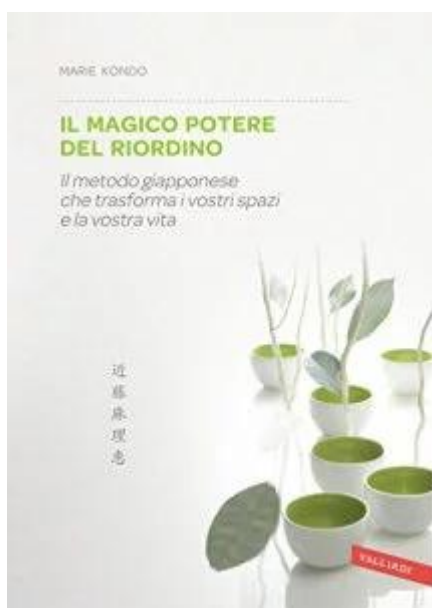
Il magico potere del riordino di cui ho scritto la recensione.