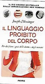
Il linguaggio proibito del corpo Joseph Messinger (Piemme, 18,50 €)

Si parla poco di seduzione, eppure è un ingrediente fondamentale sia per il primo appuntamento sia per un colloquio di lavoro. Se vuoi imparare a governare le sue regole, ecco questa "bibbia" della gestualità e del linguaggio "sexy" non verbale. Imparerai a conoscerli meglio e a intercettare le intenzioni di chi ti sta di fronte, per affrontare con successo anche le relazioni più delicate e importanti della tua vita.