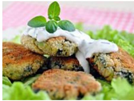
La ricetta delle polpette di ceci cotte in forno: un piatto sfizioso...