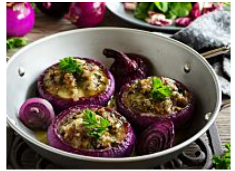
Cipolle al forno: la ricetta per prepararle con un'appetitoso...