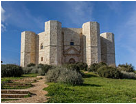
I 20 siti UNESCO più spettacolari d'Italia