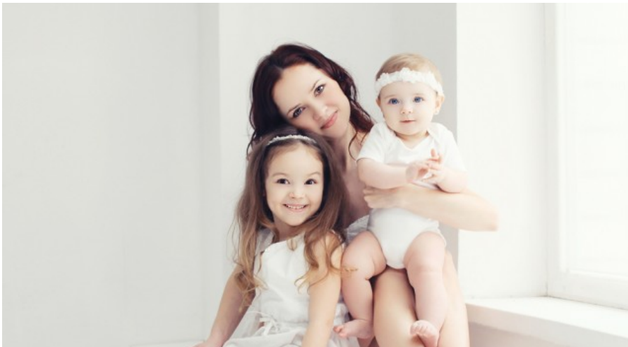
Come organizzarsi con due figli piccoli

Riunioni con tutti i membri della famiglia, responsabilità ma anche gratificazioni per il più grande, divisione dei ruoli con il padre e soprattutto difendersi del tempo per voi stessi: i consigli del professional organizer per sopravvivere con due pargoli