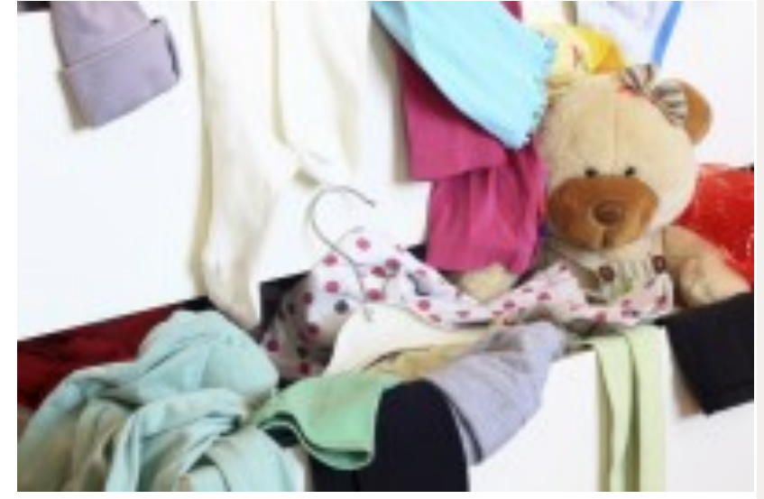
Decluttering: come eliminare il superfluo in casa