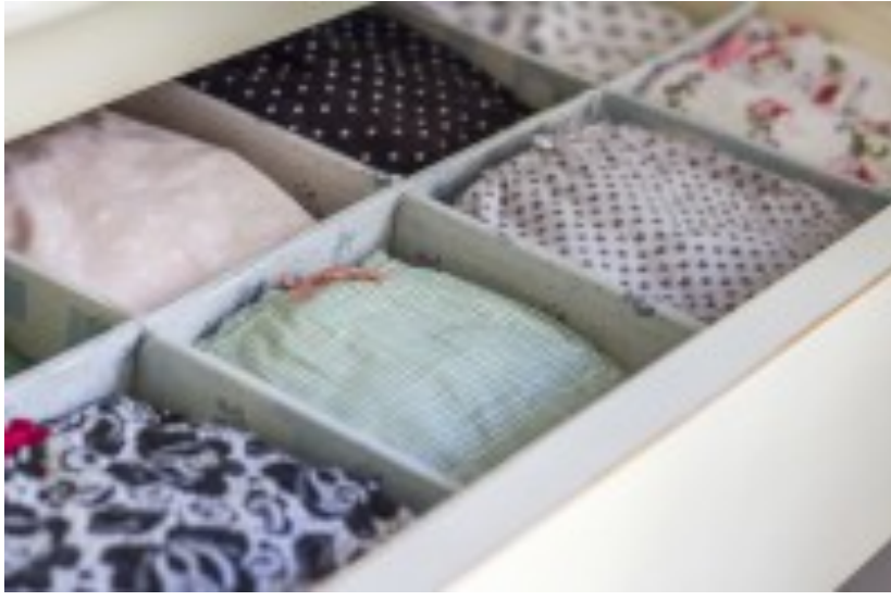
come fare ordine in casa