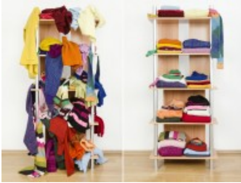
riorganizzare i propri spazi con lo space cleaner