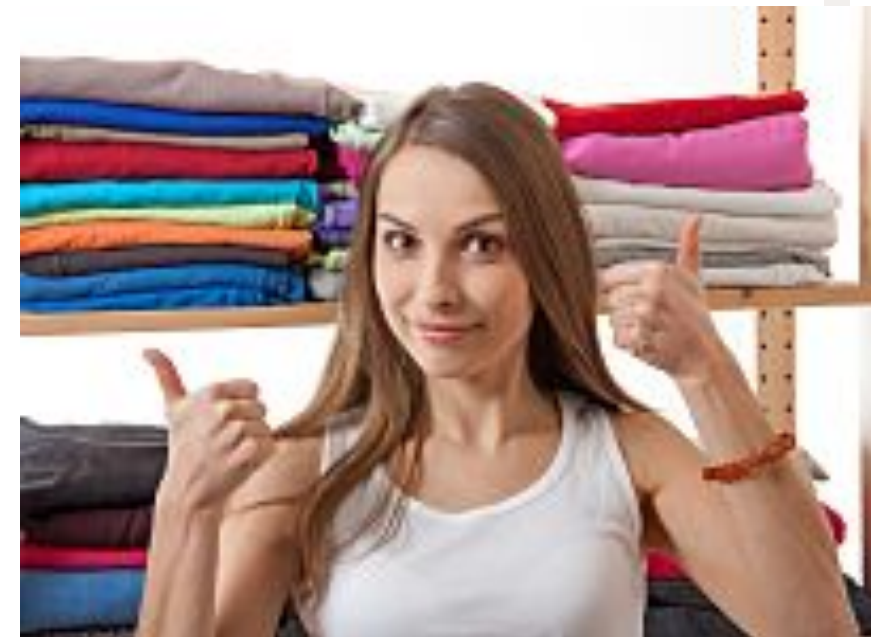
Metodo Konmari: il magico potere del riordino per non sprecare tempo...