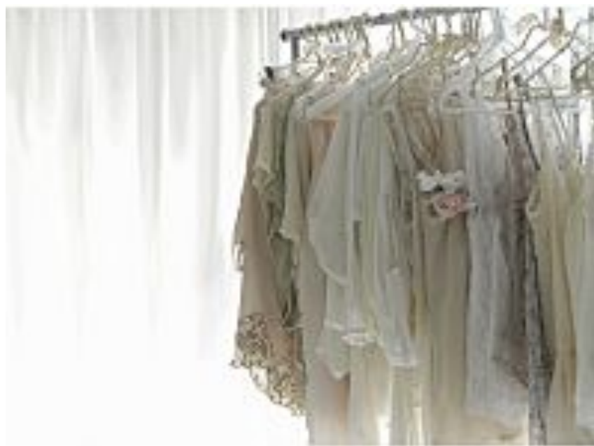
Come avere un armadio sempre in ordine: il metodo 333