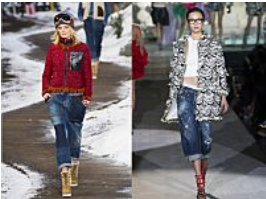
Saldi 2015: 13 pezzi da comprare ora per indossarli anche a primavera (Elle)